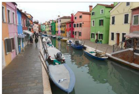
تصویر ۵. نماهای رنگی ساختمان‌ها در ونیز که ریشه در تاریخ این شهر دارد