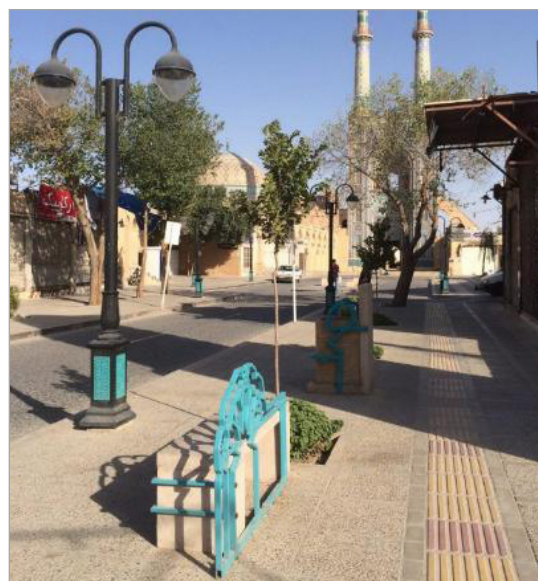
تصویر ۹. نیمکت و روشنایی خیابان مسجد جامع یزد