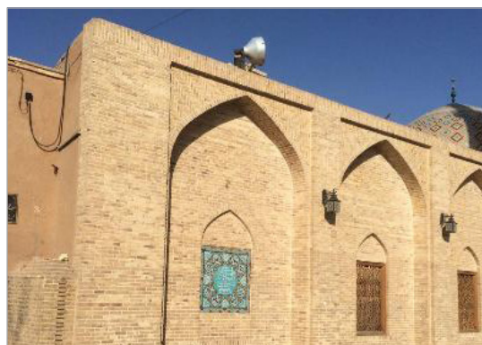
تصویر ۷. بدنه خشت خام و آجری خیابان مسجد جامع یزد (نگارندگان)