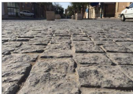
تصویر ۸. کف پوش خاکستری خیابان مسجد جامع یزد

بدنه‌ها: بدنه خیابان به‌طور عمده ترکیبی از آجر و خشت خام است (تصویرهای ۷ و ۸). سایر عناصر بدنه شامل سنگ، شیشه، پروفیل درها، کرکره و تابلوی مغازه‌ها و قاب پنجره‌هاست. لازم است بیان شود، در بررسی بدنه‌ها، الحاقات اصلی مدنظر قرار گرفت و از جزئیات موقت مانند اجناس مغازه‌ها در تهیه الگوی رنگی خودداری گردید (جدول ۳). کف: در خیابان مسجد جامع، کف‌فرش از نوع سنگ‌های خاکستری است (تصویر ۱۰) و تنها در قسمت ویژه نایبانیان در پیاده‌رو، تغییر در رنگ و مصالح ایجاد شده است (جدول ۴). عناصر مبلمان شهری: این عناصر در خیابان مسجد جامع شامل نیمکت، سطل زباله، تابلوها، چراغ‌های روشنایی و بلارد می‌شود (تصویرهای ۹ و ۱۰). این بخش، دربرگیرنده برداشت طیف‌های رنگی تمامی عناصر مبلمان و تجهیزات شهری مستقر در فضاست. بدین منظور، تصاویر مبلمان موجود در محدوده خیابان مسجد جامع جمع‌آوری گردید (جدول ۵). باتوجه‌به قرارگیری خیابان مسجد جامع در بافت تاریخی