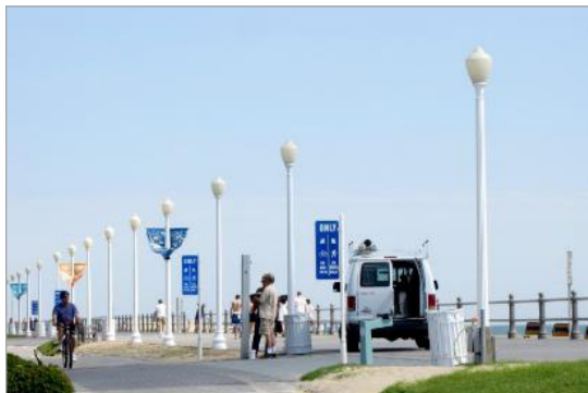
تصویر ۴. رنگ‌های متناسب با زمینه در عناصر مبلمان ساحلی ویرجینیا

در کل می‌توان دو ویژگی اساسی را برای رنگ‌های طبیعی بر شمرد که شامل جنبه‌های دینامیکی و استاتیکی می‌شوند. رنگ‌های دینامیک، دربرگیرنده تمامی عناصر طبیعی از جمله آفتاب و عوامل فصلی و آب و هواست که بر روی رنگ سایر عناصر تأثیر می‌گذارند؛ رنگ‌های استاتیک مربوط به عناصری است که در مقایسه با عناصر دینامیک از ثبات رنگی بیشتری