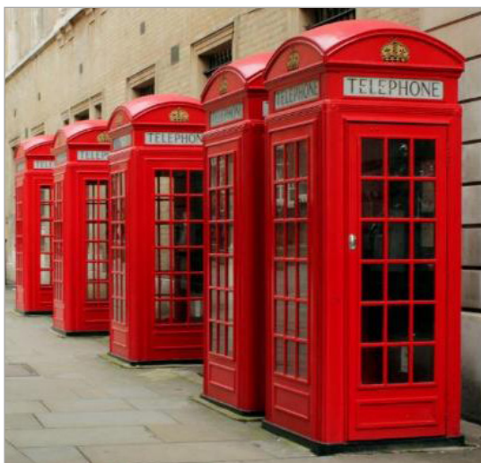
تصویر ۲. رنگ آیکونیک کیوسک‌های تلفن شهر لندن (wikipedia)

برای نمونه، می‌توان از کیوسک‌های قرمز رنگ تلفن در انگلستان نام برد که جورج گیل برت/سکات، ۳ آنها را طراحی کرده و به‌عنوان یک عنصر مبلمان شهری با هویت رنگی خاص قابل‌شناسایی و منحصر به فرد است (تصویر ۲).