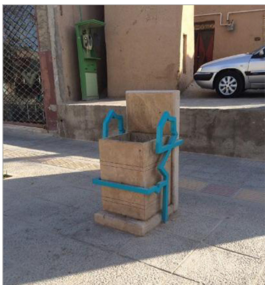
تصویر ۱۰. سطل زباله و باجه تلفن خیابان مسجد جامع یزد (نگارندگان)