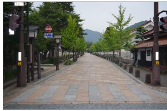
تصویر ۳. هماهنگی عناصر مبلمان شهری با عناصر طبیعی، ژاپن