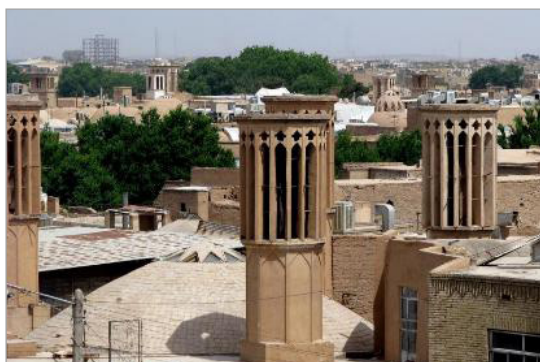
تصویر ۶. نمای عمومی از شهر یزد با رنگ‌هایی متأثر از هویت مصنوع خاص و منحصر به فرد آن

استفاده از رنگ‌های طبیعی مصالح محلی با سیمای شهری هماهنگ و همگون است و این موجب تثبیت رنگ هر شهر و جنبه‌ای از هویت آن شهر محسوب می‌شود. در شهرها و فضاهای قدیم، هر شهر هویت رنگی خاص خود را داشت. در این شهرها، بناهای شاخص شهری به‌ویژه بناهای مذهبی با تزئینات کاشی فیروزه‌ای رنگ در زمینه خاکی خود می‌درخشیدند و خود را متمایز می‌کردند. شهرهای کویری ترکیبی از آسمان آبی، بناهای خاکی، گنبد فیروزه‌ای رنگ و درختان سبز الگوی رنگی خاصی را در ذهن بیننده حک می‌نمایند که تجربه حرکت در چنین فضاهای شهری به دلیل وحدت آن، آرامش‌بخش و به دلیل هارمونی رنگی حساب شده، زیبا و سرزنده است (بیجاری و کبیر، ۱۳۸۷: ۴۹)، (تصویر ۶). ارتباط‌نداشتن محصول با محیط قرارگیری آن باعث سردرگمی و ایجاد تصویری آشفته و ناسازگار می‌شود. ضمن اینکه نه تنها تمام کاربری‌های متضاد با هویت شهری باعث آلودگی بصری می‌شوند بلکه در بافت شهری نیز مداخله می‌کنند (Bulduk, 2012: 3280). به اشتراک گذاری اطلاعات زیاد بدون قرارگیری مناسب در محیط، موجب تشویش و اغتشاش و به تبع آن کاهش کیفیت زندگی در شهر می‌شود؛