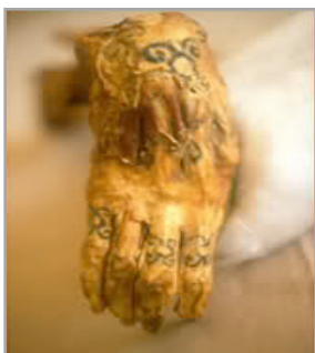
تصویر ۱. خالکوبی دست آمونت (سامانی، ۱۳۸۹)

قدیمی‌ترین جنازه‌ای که آثار خالکوبی روی بدنش دیده می‌شود، انسانی است که ۵۳۰۰ سال پیش در دوره نوسنگی زندگی می‌کرده است. این مرد، ۱۴ ساله بود. دو خط به رنگ آبی فیروزه‌ای که در امتداد ستون فقرات به موازات هم ادامه می‌یابد و چند خط و اشکال مدور بر روی کمر و ساق پا و نقشی شبیه یک صلیب کوچک بر زانوی پای راست، از خالکوبی‌های یافت‌شده بر روی بدن اوتسی است. همچنین، در جنازه مومیایی‌های مصری اشکال متنوعی از خالکوبی‌ها وجود دارد. مانند خالکوبی‌های انجام‌شده در دستان یکی از کهنین زن که آمونت ۱۵ نام داشته و ۴۰۰۰ سال پیش در مصر زندگی می‌کرده است (Parry, 2006: 12)، (تصویر ۱). لوح سنگی حاوی قوانین حمورابی که در منطقه شوش یافت شده، قدیمی‌ترین سندی است که در خصوص خالکوبی وجود دارد. در یکی از بندهای قانون حمورابی آمده است: اگر کسی بدون اجازه مالک و ارباب خود، خال یا علامتی را بر بدن برده‌ای به‌نحوی که مانع از فروش او شود، خالکوبی نماید باید انگشتان فرد خالکوب قطع گردد. همچنین به موجب ماده ۲۲۷، اگر فرد خالکوب فریب خورده و علامت نبخشیدنی و نفروختنی را بر بدن برده متعلق به دیگری خالکوبی کند، باید سوگند یاد نماید که این عمل را عمداً انجام نداده تا تبرئه شده و مجازاتی که به فریبکار تعلق می‌گیرد، درباره او اجرا نشود (سامانی، ۱۳۸۹). در زمان‌های بسیار قدیم خالکوبی امری آیینی بود. در برخی زمان‌ها این روش برای نشان کردن افرادی به‌کار گرفته