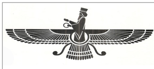
تصویر ۲. نقش فروهر

امروزه نیز ایجاد نظم و چیدمان نقوش و ترکیب‌های مختلف در این هنر، افزوده بر مهارت هنرمند از طریق پیشرفت‌های علمی به خدمت هنر درآمده چه در مرحله طراحی و چه در مرحله اجرای نقوش، بر تن اعمال شدنی است. گاهی هم در طرح‌های هندسی و هم در طرح‌های واقع‌گرایانه به استفاده از شابلون برداری بر می‌خوریم (تصویر ۲).