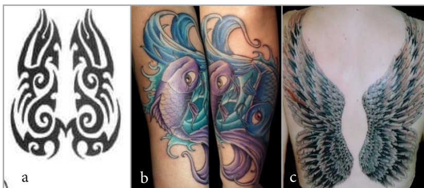
تصویر ۳. a: نقش انتزاعی معروف به نقش تریبال، b: نقش ماهی، c: نقش بال پرنده (www.alrml.net; www.trendhunter.com)

نقوش تزیینی از دلالت‌های اجتماعی، هویتی و زیبایی برخوردارند و برای همه نقوش نباید در پی معنای چندان پیچیده‌ای باشیم، زیرا انسان همه چیز را با معنای نمادین تجربه نمی‌کند بلکه با وجه تزیینی نیز تجربه می‌کند. کتابک به این موضوع اشاره کرده است که انسان‌ها معانی و ارزش‌های خاص خودشان را به متن‌ها و فرآورده‌هایی که دریافت می‌کنند، نسبت می‌دهند و آن معانی برآمده از تجربه‌ها و بافت فرهنگی آنهاست؛ گرچه، ورود برخی از عناصر نیز از فرهنگ‌های دیگر اتفاق افتاده که آنها نیز در فرهنگ محلی تعدیل می‌شوند (کتابک، ۱۳۸۶: ۸۲۳). تزیینات به کاررفته در میان اقوام قبایل سراسر دنیا ارزش مشخصی دارند، در واقع بامعنی هستند و در این صورت قابل تفسیر نیز (بوآس، ۱۳۹۱: ۱۵۹). همچنین هر کنش در جامعه دارای لایه‌های معنایی است.