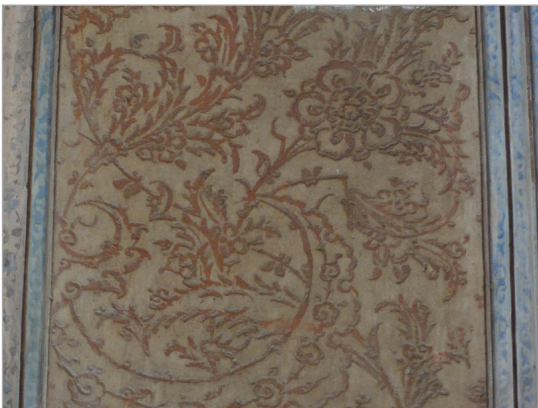
تصویر ۱۱. اجرای نقش مایه گل در کاخ عالی‌قاپو به شیوه لایه‌چینی (نگارندگان)