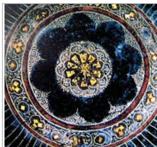
تصویر ۴. گل هشت پر ایلخانی (بهمنی و دادور، ۱۳۹۵: ۳۱)

به‌طور کلی، به تمام گل‌هایی که در طراحی آنها از تقسیم‌بندی پنج قسمتی استفاده می‌شود، گل پنج پر می‌گویند. بدین معنی ممکن است آنها دارای گلبرگ‌های اضافه‌تری باشند که در زیر یا روی پنج پر اصلی قرار گرفته که از یک خانواده محسوب شده و جزء گل‌های پنج پر به حساب می‌آیند. گل پنج پر، عامل تحول و تنوع نقوش می‌شود و در تزئین و هماهنگی طرح‌های ختایی، نقش عمده‌ای را بازی می‌کند. این نقش عموماً از دو بخش اصلی مرکز گل و گلبرگ‌ها تشکیل شده و هر یک از آنها دارای تزئینات ساده تا پیچیده‌ای است.