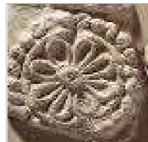
تصویر ۲. گل دوازده پر ساسانی (URL: 2)