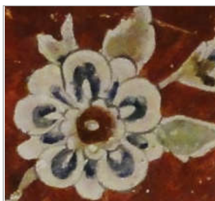
تصویر ۷. گل پنج پر کاخ چهل‌ستون