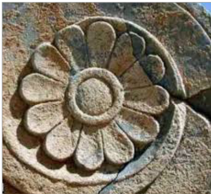
تصویر ۱. گل دوازده پر هخامنشی (URL: 1)

این نقش‌مایه در آثار تاریخی ایران نقش به‌سزایی دارد و نشانگر اهمیت و تقدس این گل بوده است. گل چند پر در ابتدا به صورت هنری آیینی و با دوازده پر، برای اشیایی که درجه بالایی از نظر کاربرد مذهبی یا درباری داشته‌اند به کار رفته، اما پس از گذشت سال‌ها تبدیل به هنری کاربردی شده است. این امر در تمدن ایران از دوره ساسانی انجام