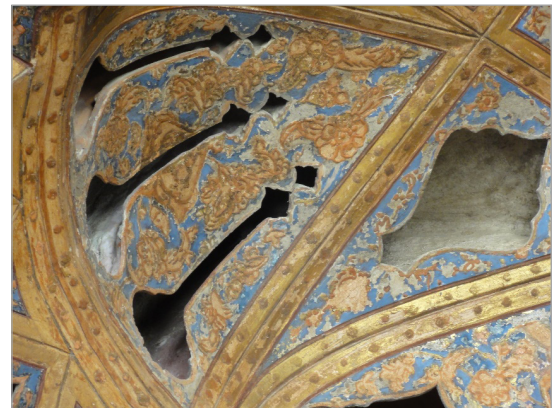
تصویر ۱۰. اجرای نقش مایه گل در کاخ عالی‌قاپو به شیوه لایه‌چینی و طلاچسبانی (نگارندگان)