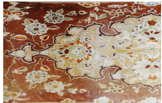
تصویر ۸. اجرای نقش مایه گل در کاخ عالی‌قاپو به شیوه کشته‌بری (با تکنیک بوم‌ساب) (نگارندگان)