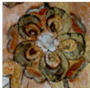
تصویر ۶. گل پنج پر کاخ عالی‌قاپو