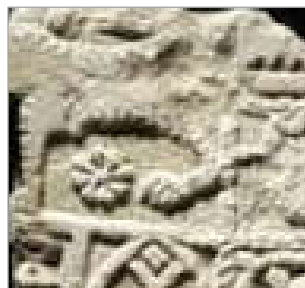
تصویر ۳. گل هشت پر سلجوقی (URL: 3)