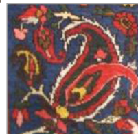
تصویر ۸. الف. خشت بته‌ای ب. بته گوشه ج. شاه‌عباسی (نگارندگان، ۱۳۹۴)