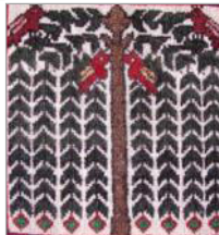
تصویر ۶. الف. خشت محرابی ب. بید مجنون ج. سیل یا سرو (نگارندگان، ۱۳۹۴)