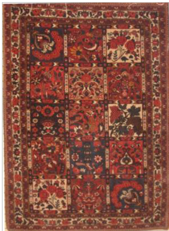
تصویر ۲. قالی خشتی

مهم‌ترین اصول گشتالت که در تجزیه و تحلیل آثار هنری به کار می‌رود، عبارت‌اند از: مشابهت، مجاورت (نزدیکی لبه‌ها و تماس)، تداوم، فراگیری (تقارن و تعادل و ابعاد و تناسب). این اصول تحت نفوذ اصل پراگماتیک قرار دارد که هسته مرکزی نظریه ادراکی گشتالت را تشکیل می‌دهد. کلمه پراگماتیک به معنای "شکل خوب است" و قانون خوب یا قانون ساده نامیده می‌شود. طبق این قانون، اشیا یا تصاویر موجود به شکل ساده‌ای به نظر می‌رسند به‌گونه‌ای که راحت‌تر قابل دیدن باشند (شاپوریان، ۱۳۸۶: ۹۴). غیر از اصول ذکر شده در قانون گشتالت و باتوجه به تجربیات شخصی و تحقیقات انجام شده