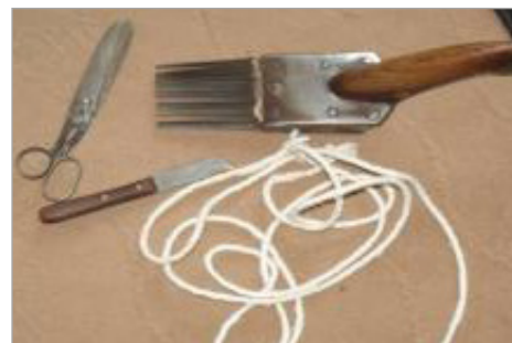
تصویر ۱۳. ابزارهای بافت در چالش‌تر (نگارندگان، ۱۳۹۴)