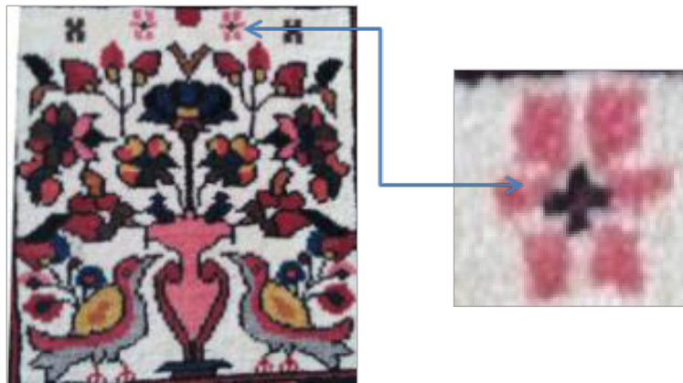
تصویر ۱۰. نقوش چاپرکن یا پشه در خشت گلدان و پرند (نگارندگان، ۱۳۹۳)

اگر به قالی‌های خشتی با دقت نگریسته شود، تقریباً تمام رویه قالی (خشت‌ها و حاشیه‌ها) از عناصر ریز و درشت پوشیده شده است. مسلم این است که به‌هیچ‌وجه پوشیدگی پاسخگوی نیاز ترکیب‌بندی اثر هنری نیست؛ بسیار اتفاق افتاده که هنرمند برای دستیابی به یک پوشیدگی زیبا و خوشایند عناصر ترکیب را، خواه ذرات مستقل ریزنقش‌ها باشد و خواه شکل‌های بزرگ‌تر و گسترده‌های مشخص و متمایز، درون یکدیگر و یا به‌صورت فرا نهادن آنها بر یکدیگر در ترکیب اثر