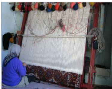
تصویر ۱۴. الف. دار افقی یا زمینی ب. دار آرگونومیک (مجموعه عکس میراث فرهنگی، ۱۳۸۶)

تکنیک‌های بافت و انواع آن در منطقه چالش‌تر: از لحاظ