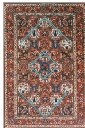
تصویر ۳. قالی خشتی

طبق قانون مجاورت، پدیده‌ها و اموری که نزدیک هم قرار دارند، به‌صورت کل یکپارچه و یا یک گروه واحد درک می‌شوند. نزدیکی عناصر بصری ساده‌ترین شرط برای باهم دیدن آنهاست. ما میل داریم که واحدهای بصری نزدیک