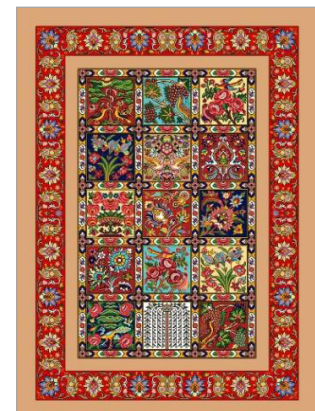
تصویر ۷. طرح تک‌خشت یا غلط