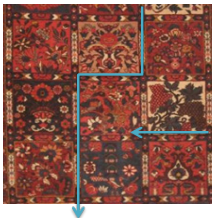
تصویر ۴. قلمدان در قالی خشتی

براین اساس هرچه اجزای یک ساختار بصری بیشتر به هم نزدیک باشد، بیشتر همچون یک گروه واحد دیده خواهد شد. این زمانی اتفاق می‌افتد که لبه‌های کناری اجزای یک ساختار در کنار هم قرار گیرند. همچنین طبق قانون تماس، ممکن است اجزای یک ساختار چنان به هم نزدیک شود که با هم برخورد و همدیگر را لمس کند مشروط بر اینکه هنوز آن دو یا چند جزء بصری از همدیگر قابل تشخیص باشند. به‌طور تقریبی مقوله نزدیکی لبه‌ها و تماس در قالی خشتی به یک نسبت مشاهده می‌شود. تکرار خشت‌ها در متن قالی و به‌صورت منظم در عرض و طول قالی انجام می‌شود. تنها فضایی که بین این خشت‌ها را پر می‌کند فضای باریکی به نام قلمدان است که با توجه به ابعاد قالی از ۷ تا ۲۰ گره در قالی زرع و نیم تا ۳۵ متری بافته می‌شود (تصویر ۴).