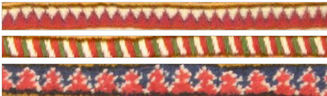
تصویر ۱۲. الف. طرح کوه‌کوهی ب. پرچمی ج. کله‌قندی (نگارندگان، ۱۳۹۳)

گره: در اصطلاح بومی، گند، مورد استفاده در منطقه چالش‌تر گره متقارن بدون استفاده از قلاب است. برای بریدن خامه پرز از چاقوی فارسی استفاده می‌کنند. برای کوبیدن گره‌های بافته‌شده در هر رج از دفتین‌هایی استفاده می‌کنند که دسته آنها مورب است. از شانه جهت پیش کشیدگی گره‌ها استفاده می‌شود. در نهایت، رج بافته‌شده با قیچی‌های بلندی