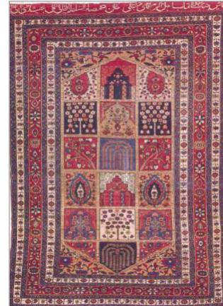
تصویر ۵. قالی خشتی محرابی