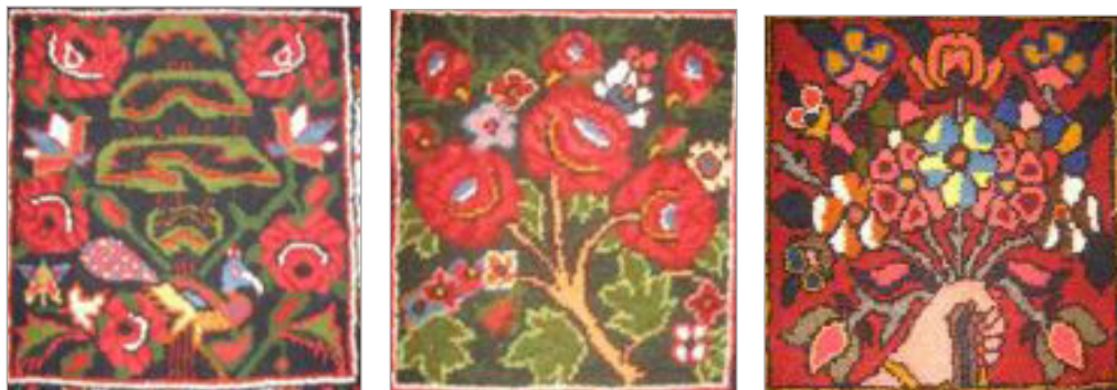
تصویر ۹. الف. خشت سه لندنی ب. دست‌دلبر ج. کاج (نگارندگان، ۱۳۹۴)

ذره‌گرایی در زیبایی‌شناسی به این معنی است که اثر هنری از بی‌نهایت ذره‌های ریز و مستقل تصویری تشکیل شده است که هر کدامشان در کمال نسبی خود، ساخته و پرداخته شده‌اند؛ ولیکن هیچ کدام از آنها به‌تنهایی در ترکیب‌بندی اثر چندان تأثیر و مدخلیتی ندارند؛ اما، مجموع‌هایی از آنهاست که شکل‌هایی را می‌سازند که به‌مثابه عنصر ترکیب‌گر اثر هنری، در ترکیب آن وارد می‌شود (آیت‌اللهی، ۱۳۹۲: ۴۵). برای مثال، گل‌های ریز یا چندپر، برگ‌ها، شکوفه‌ها یا شکل‌هایی که برای تزیین و یا پرکردن فضاهاى تهی به‌کاربرده می‌شوند؛ هر کدامشان در کمال دقت و زیبایی ساخته شده‌اند؛ ولی هیچ کدام به‌صورت مستقل و ذاتاً در ترکیب‌بندی دخالتی ندارند، بلکه مجموعه این عوامل است که خشت‌ها را به بار می‌آورد. این ذرات موجودات