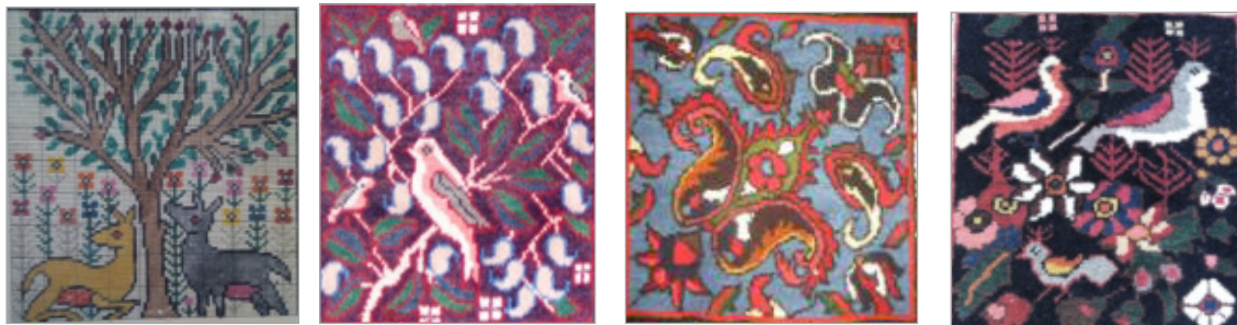
تصویر ۱۱. الف. خشت دو پرند ب. بته گوشه ج. چمن آهو و بادام (نگارندگان، ۱۳۹۳)