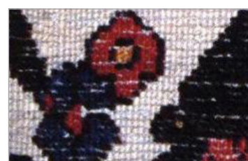
تصویر ۱۵. شیوه لول باف (فورد، ۱۹۸۱: ۲۱)