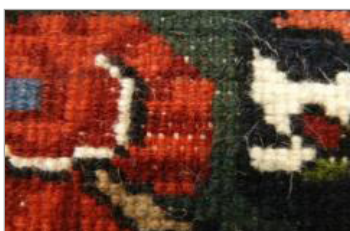
تصویر ۱۶. شیوه نیم‌لول (نگارندگان، ۱۳۹۴)