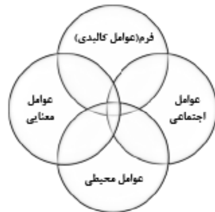
تصویر ۱. مؤلفه‌ها و ابعاد مفهومی فضاهای شهری براساس دیدگاه‌های اندیشمندان مختلف این حوزه (نگارنگان، ۱۳۹۴)

اسداللهی (۱۳۸۹) در یک کار تحقیقاتی، کاربردهای اصلی و حوزه‌های فعالیت گرافیک شهری را بدین صورت تقسیم‌بندی می‌کند: ۱. علائم تصویری خدمات عمومی شهری، علائم راهنمایی و رانندگی در شهرها و بزرگراه‌ها، هدایت تصویری