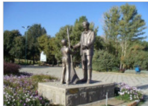
تصویر ۵. مجسمه مرد رفتگر در پارک مردم همدان