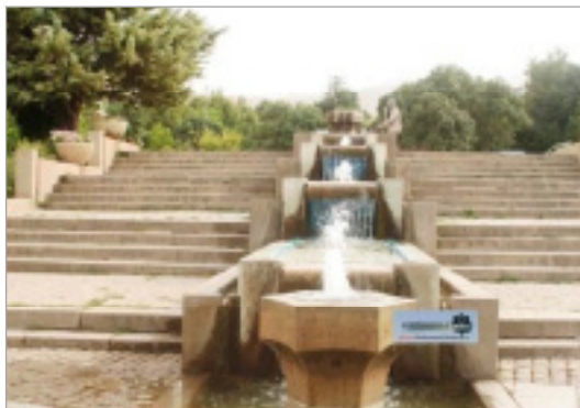
تصویر ۶. آب‌نما و فواره آب در پارک مردم همدان (نگارندگان)