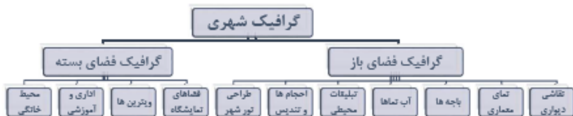
تصویر ۲. نمودار عناصر و ابزارهای گرافیک شهری در فضاهای عمومی (Gehl, 1987:74)