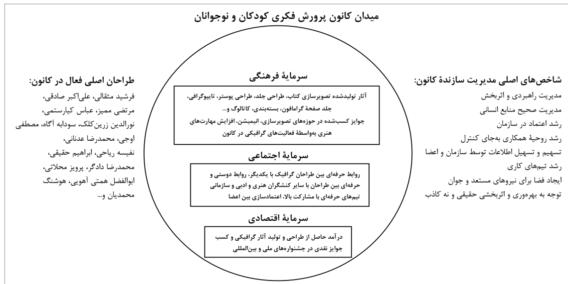
نمودار ۳. کانون و افزایش سرمایه‌های اجتماعی، اقتصادی و فرهنگی طراحان گرافیک (نگارندگان)